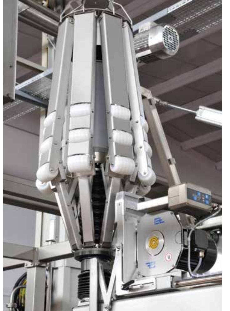
Top kumaş kesme ünitesi / Roll fabric cutting unit