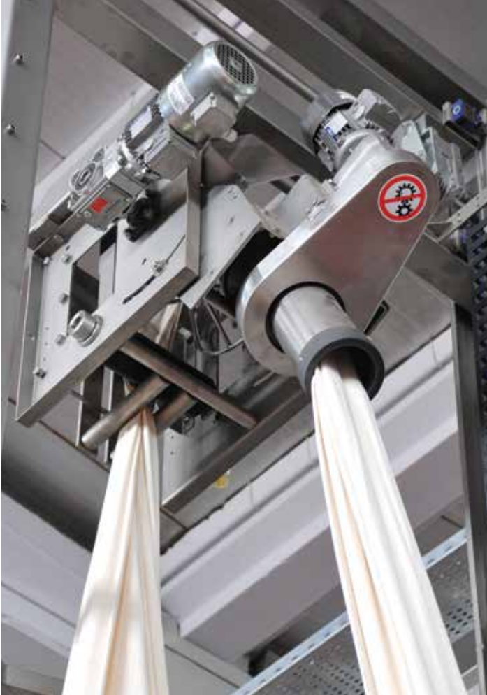
De-Twister Halat Açıcı / De-Twister Rope Opener