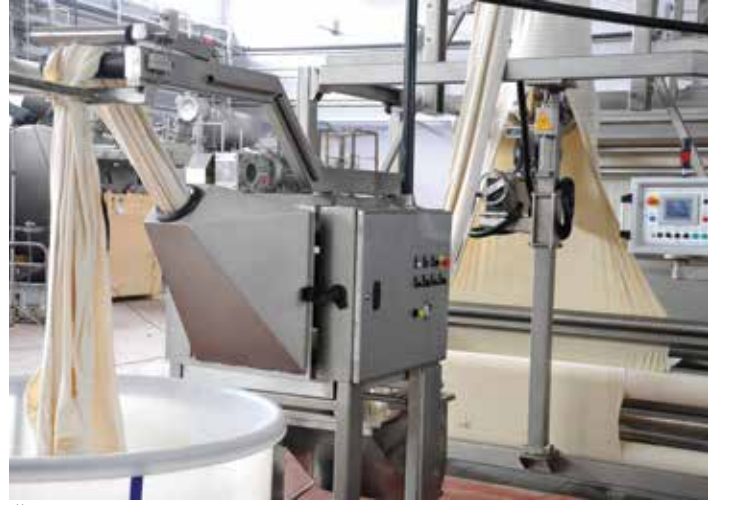
Ön sıkma / Pre squeezing