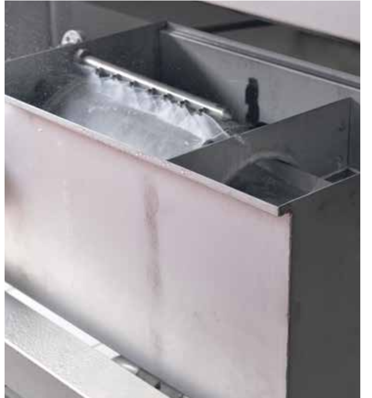
Otomatik filtre / Automatic filter