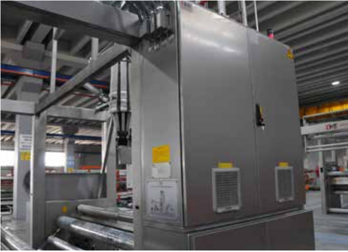
Entegre edilmiş ana pano / Integrated main board