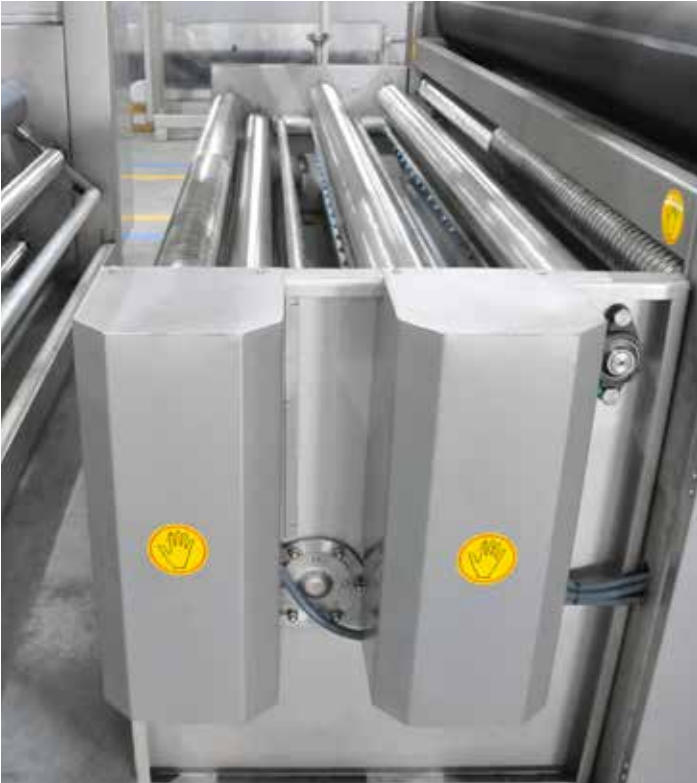
Enzim yıkama sistemi / Enzyme washing system